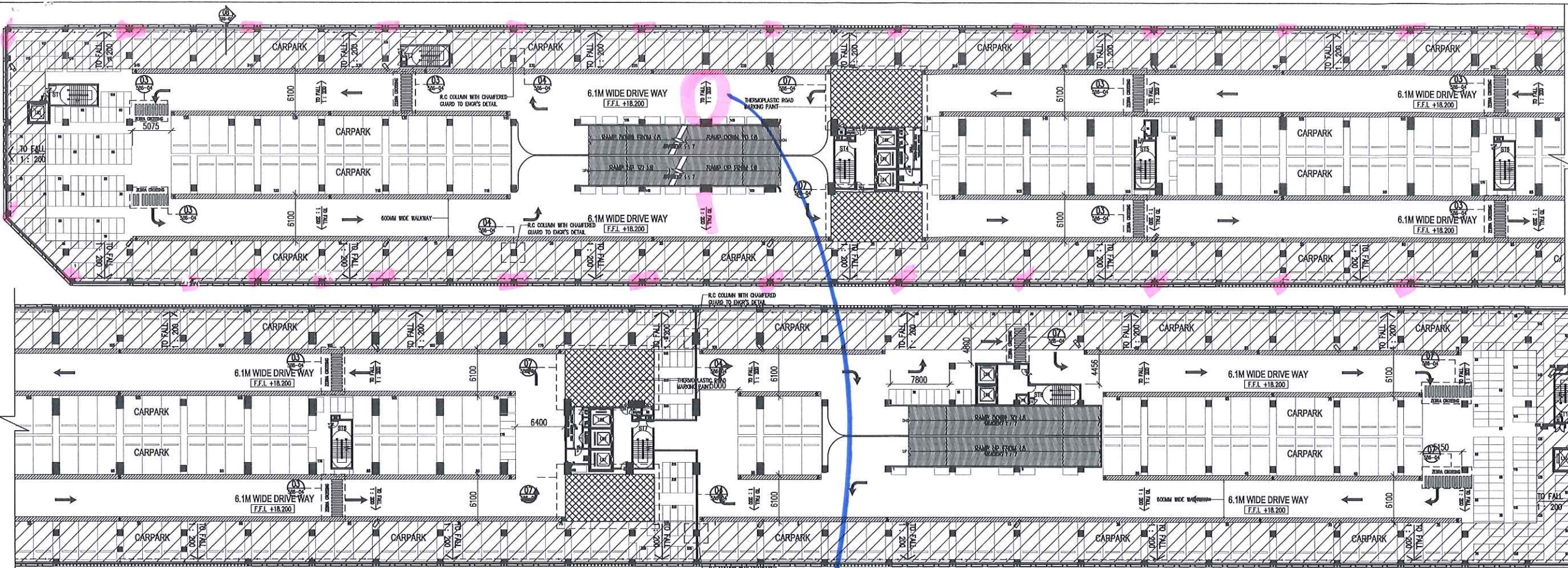
04 CARPARK DETAIL - LEVEL 7 586 SCALE = 1 : 300